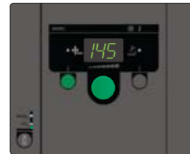
De Omega Basis voor allround laswerkzaamheden, vooral in koolstofstaal met puur CO 2 of menggas.

De Omega-machines kunnen met twee verschillende synergische bedieningspanelen met verschillende functies en eigenschappen worden geleverd. De Omega 270 Mini wordt altijd met een geavanceerd bedieningspaneel geleverd.