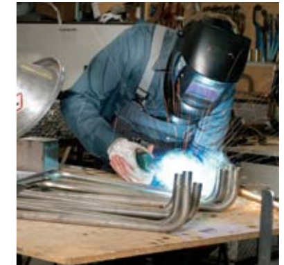
Constructie van roestvast stalen producten met behulp van DUO Plus.