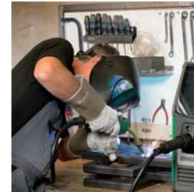
Lassen van profielen van meubelframes in koolstofstaal.