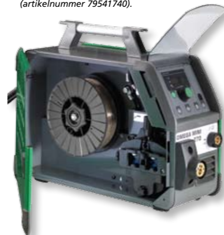
De draagbare Omega Mini 270 beschikt over omgekeerde polariteit (artikelnummer 79541740).