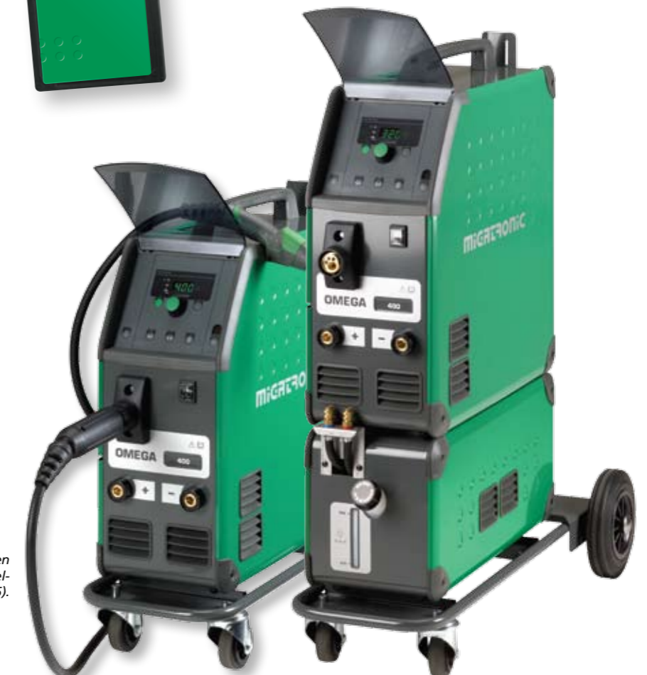
Omega 400 Geavanceerd luchtgekoeld en Omega 400 Geavanceerd watergekoeld op onderstel (artikelnummers 79541750 / 79541755).

In de Omega-machines is een programmeerder verwerkt, goed bereikbaar in de draadtoevoerkoffer, voor een eenvoudige en snelle software-update via de SD-kaart. De lasmachines zijn ontworpen om te voldoen aan de nieuwe eisen op het gebied van materialen en beschermgassen.