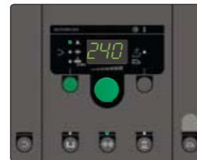
De Omega Geavanceerd heeft de functie DUO Plus™ voor professioneel gebruik in de industrie. Ontworpen voor MIG-solderen en -lassen met gevulde of massieve draden in koolstofstaal, aluminium en roestvaste materialen.