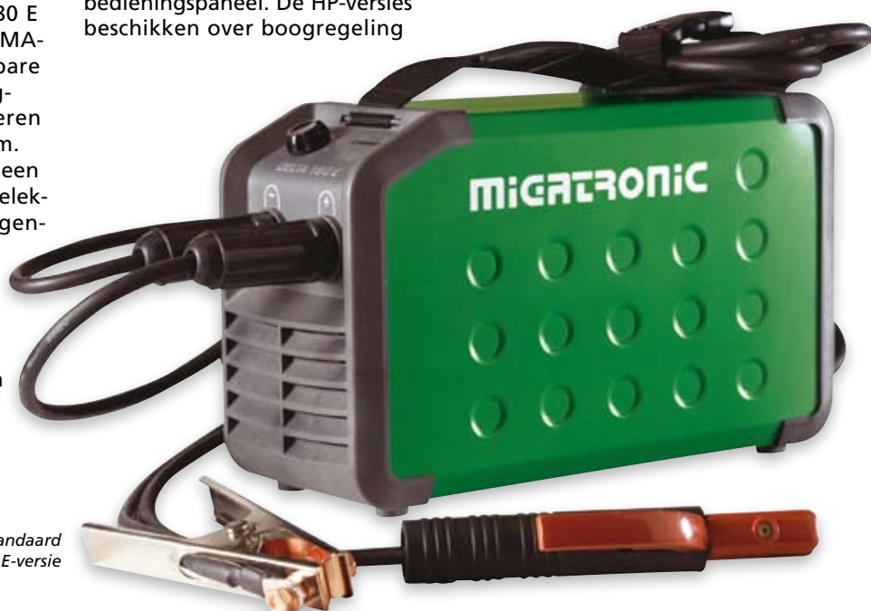
De standaard Delta E-versie

De Delta 140 E, 160 E en 180 E zijn uiterst betrouwbare MMA-machines die in allerlei lasbare materialen lassen van hoogwaardige kwaliteit produceren met elektroden tot 3,25 mm. De lasser kan kiezen tussen een plus- of minpolariteit op de elektrodetang. Voorzien van eigenschappen zoals hotstart, boogregeling en bescherming tegen spanningschommelingen. Met de aanstrijk-ontsteking kunnen de MMA-versies ook worden gebruikt voor eenvoudige TIG-lasklussen.