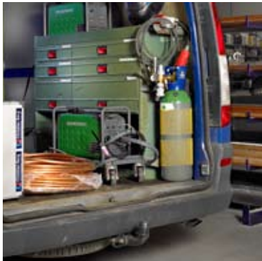
Migatronik Delta op de gebruikelijke plaats in de servicewagen.