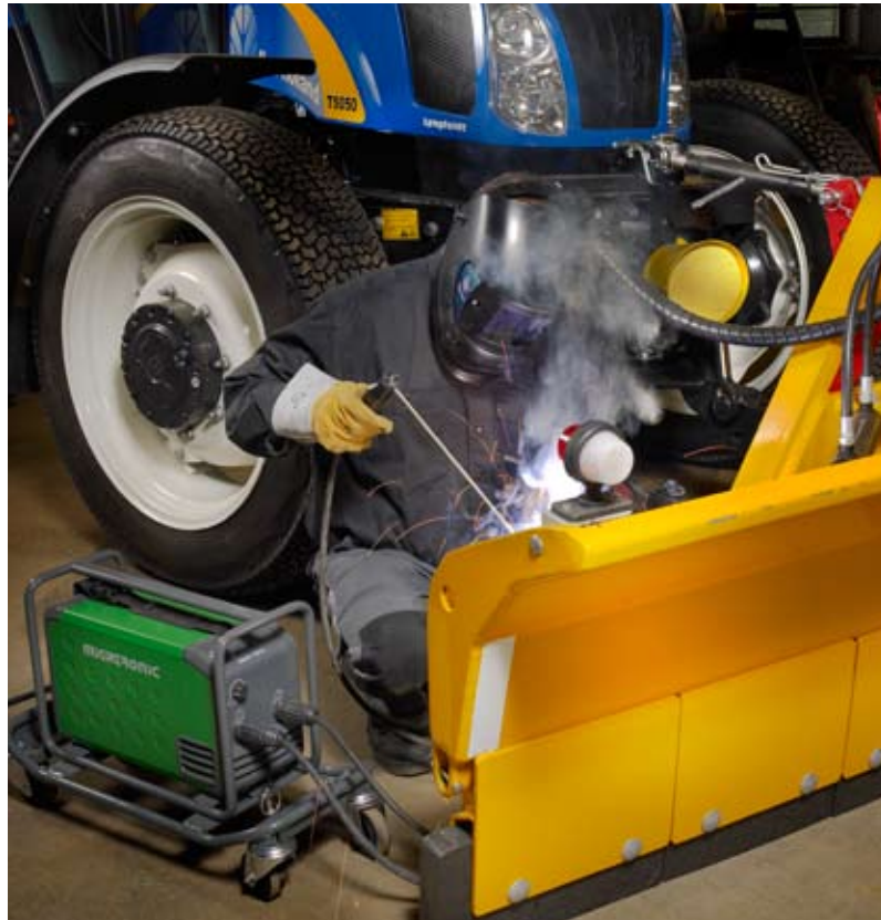
De handige Delta in actie in de werkplaats - met beschermend frame en onderstel met wielen.