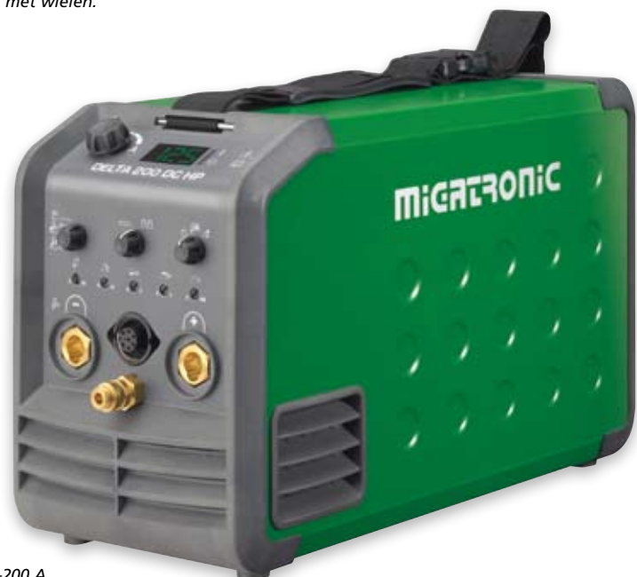
Delta 200 DC HP - de grootste TIG-versie met traploze puls en hoog vermogen in het stroombereik 5-200 A